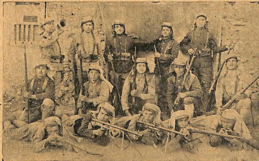
ԷՎԷՐԷԿՑԻ ՀԱՅ ԿԱՄԱՒՈՐՆԵՐ՝ ԿԻՊՐՈՍԻ ՄԷՋ