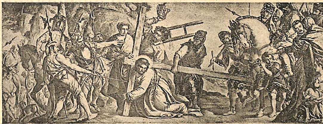
ԲՈՒՆՆԵՐ ԳՆԱԿԱՆՆԵՐ.—Յիսուս՝ խաչի բռնից օտկ (Լուսին Թանգարան)