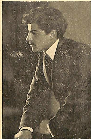
Ս. ՍԵՒԱԿ՝ 1908ին

— Ո՞վ է այս համակրելի տղան, որ տաղանդալ ունի:»