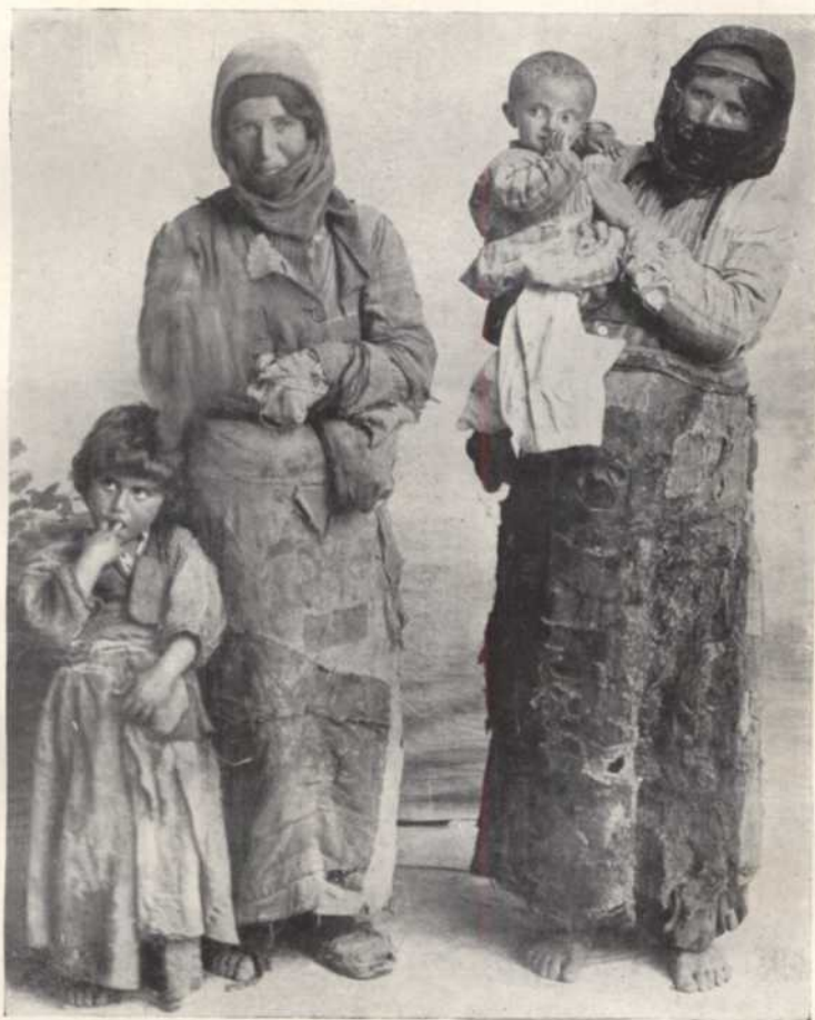
Թումարզացի գիւղացի հայ կիներ արքայի նամբուն վրայ Շարս- պրլիսի մօտ լուսանկարուած գերման զինուորականներէ 1915ին:

~ Paysannes Arméniennes du village de Comar- za sur la route de la déportation près de Djarsabekis photographées par des militaires Allemands en 1915.