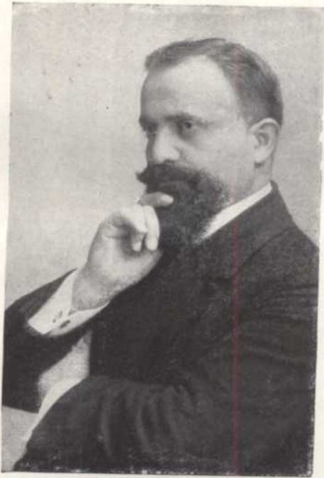
Տ. Կրիզորիս Ժ. Վարդ. Պալարեան Պետլին իբր ուսանող:

Père D. Krikoris Basakian à Berlin, comme étudiant