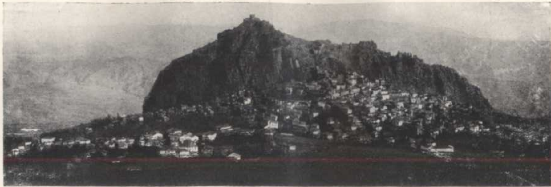
Հերոս Եսայինգարահիսարը՝ ծննդավայր զօրվ. Անդրանիկի:

~ L'héroïque Chabin - Karabissar, lieu de naissance du général Antranik.