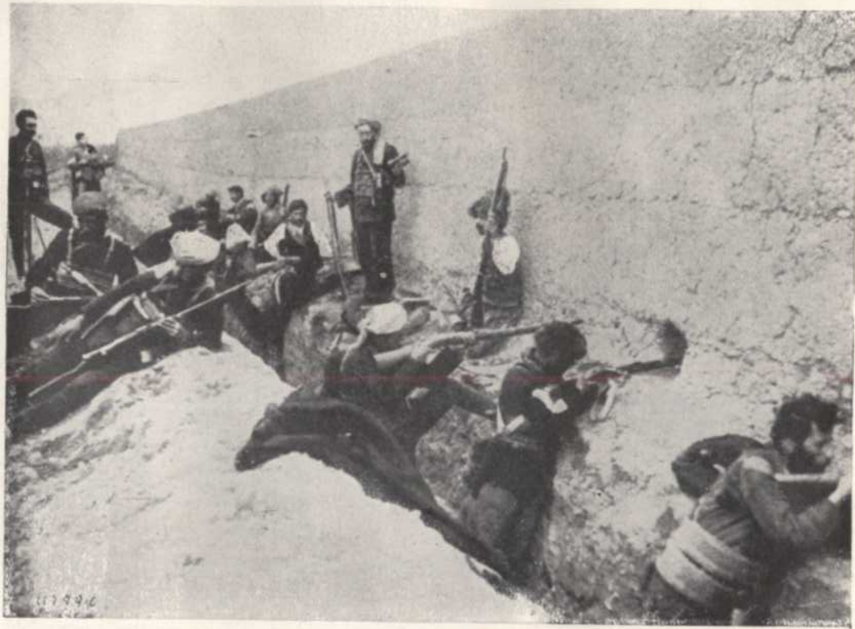
Վանի հայոց ինքնապաշտպանության ժամանակ 1915 Ապրիլին: L'heroïque autodefense des Armeniens de Van en Avril 1915.