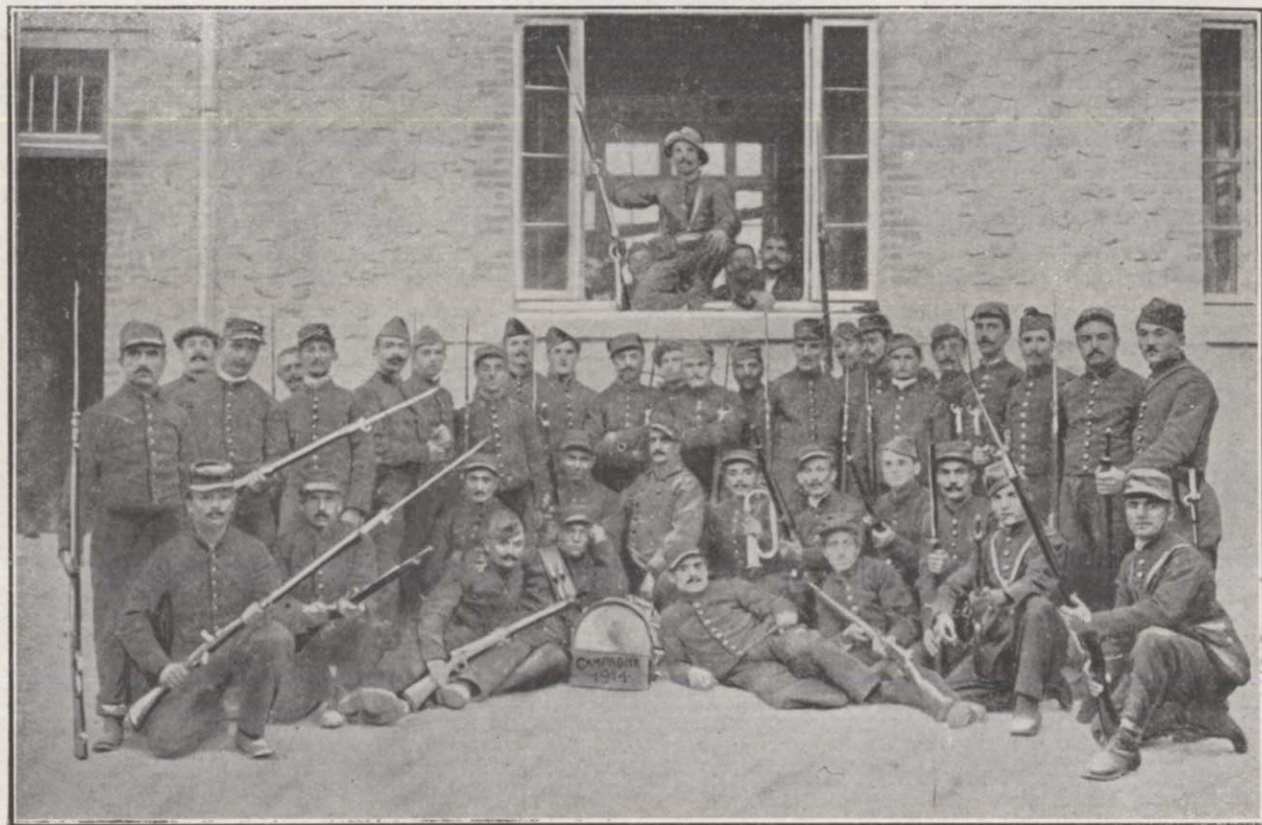
Un groupe de volontaires Arméniens de Paris.