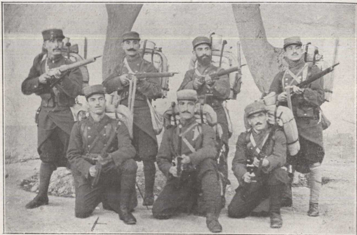
Un groupe de Volontaires de Marseille et de Paris