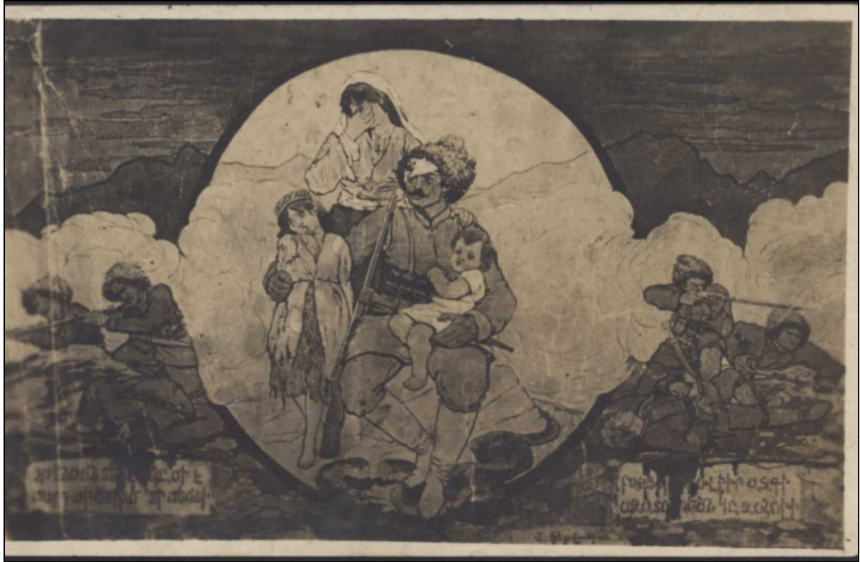
Carte postale qui a servit de support.