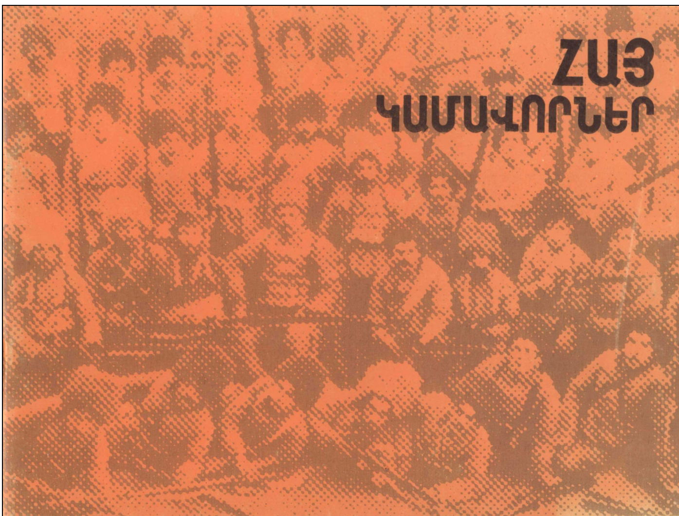
Les volontaires Arméniens , brochure éditée en 1990 .