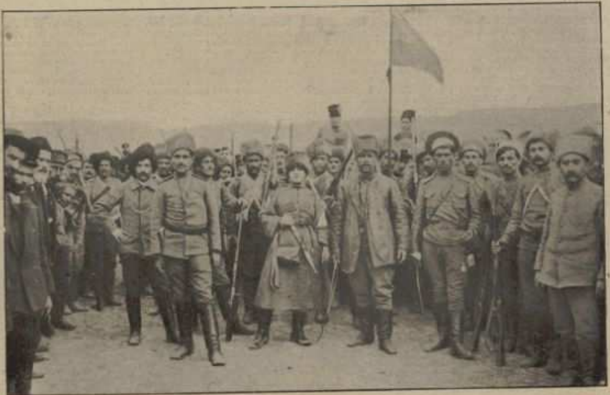
AU MILIEU, UNE JEUNE FILLE ARMÉNIENNE qui a pris les armes pour la libération de son pays.