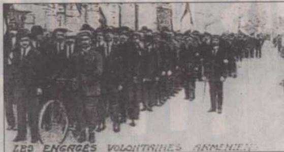
Les engagés volontaires arméniens.

Cet engagement se prolongera lors de la seconde guerre