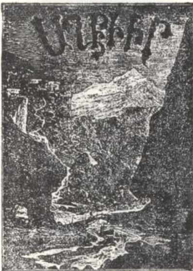
ՊԱՏԿԵՐԱԶԱՐԴ ՄԱՆԿԱԿԱՆ ԱՄՍԱԳԻՐ ԵՒ ՅԱՒԵԼԻԱՍՈՎ՝ ԴԱՍՏԻԱՐԱԿՆԵՐԻ ՀԱՍԱՐ

Թիֆլիս Խմբագիր Հրատարակիչ 1883—1918 Տիգրան Նազարեան Տպ. Վրաց. հրատ. ընկ. 48 էջ, 16 x 26 5. մետր ապա Ն. Աղանեանի