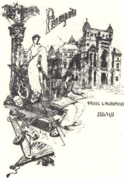
ԳՐԱՆ Ա ՔԱՆԵՐԱՆ ՀԱՆԴԷՍ