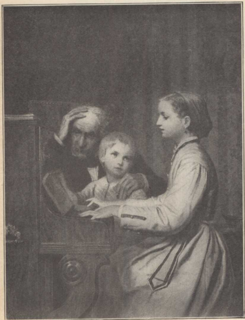
Un air national.