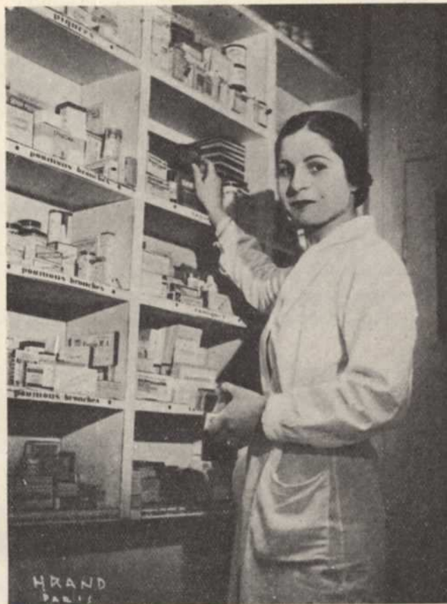
ԳԵՂԱՐՆԵՆ ԻՆՎ ԱՆՈՒՆԵՐ