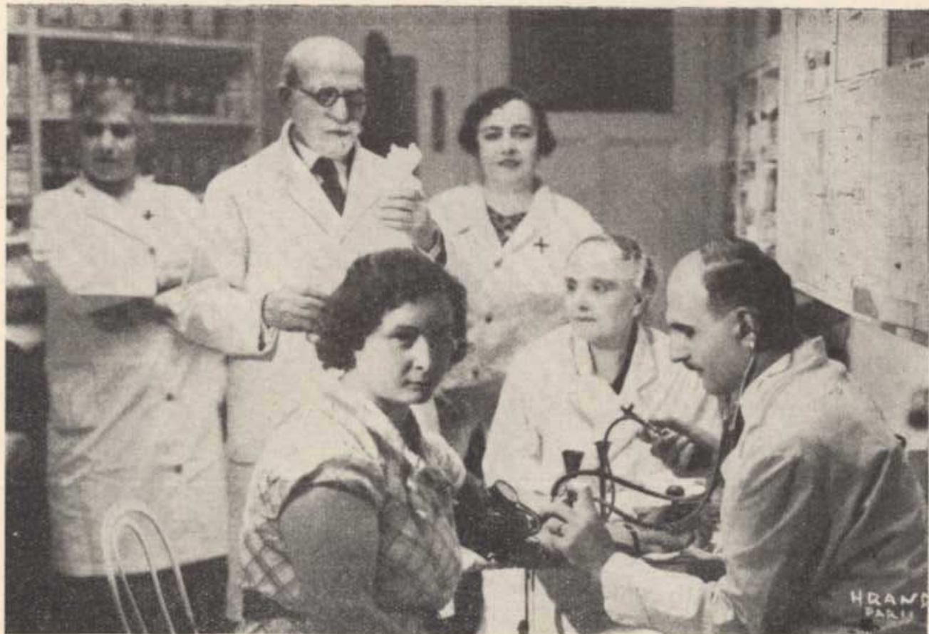
ԲՈՒԺՎԱԿԱՆ ՓՆՆՈՒԹՅՈՒՆ ՄԸ ԲՈՒԺԱՐԱՆԻՆ ՄԷՋ