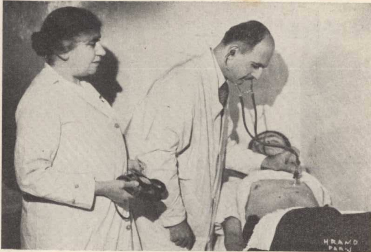
ԲՈՒՆԻՔԱՆԻ ՔՆՆՈՒԹԻՒՆ ՄԵՐ ԲՈՒԺԱՐԱՆԻՆ ՄԷ՞՞՞