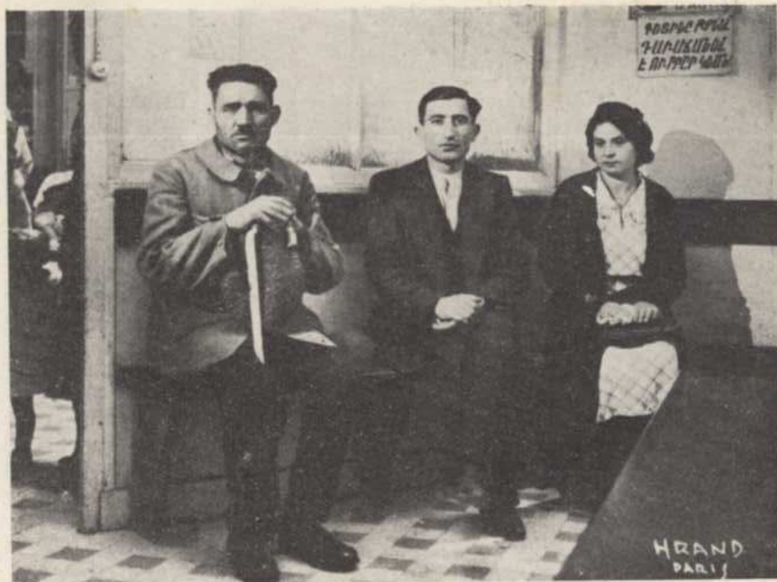
ՍՊԱՍՄԱՆ ՍՐԱՀԻՆ ՄԵԿ ԱՆՎԻՆԸ ԻՐԵՆՑ ԿԱՐԳԻՆ ՍՊԱՍՈՂ ՀԻՒԱՆԳՆԵՐ