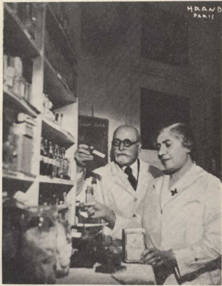
ՔԻՄԻԱԿԱՆ ՎԵՐԼՈՒՄՈՒՄՆԵՐՈՒ (analyses) ԵՆ ԴԵՂԵՐԸ ՊԱՏՐԱՍԵԼՈՒ ՅԱՏՈՒԿ ՄԱՍՆԱՍԵՆՆԵԱԿԸ ԲՈՒԺԱՐԱՆԻՆ ՄԷՋ