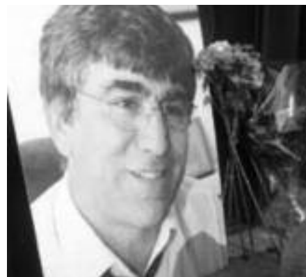
Յունուարի տասնըննին կարկոտ տեղաց իր գլխին մեր գլխին...

Անդարան ունի քանի մը ղլխադարձեր, որոնք (Շարք տեսնել էջ 7)