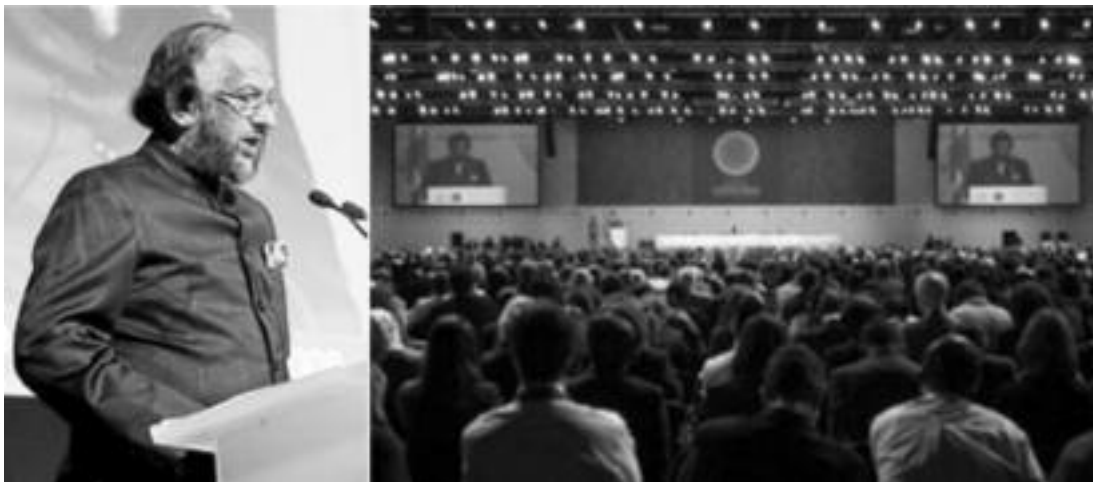
Le discours du prix Nobel de la Paix, l'Indien Rajendra K. Pachauri n'aura pas eu l'effet escompté.

Sur le plan politique, on ne peut que déplorer que sur une question aussi grave, on n'ait pas trouvé les moyens d'un accord. Chacun a défendu ses intérêts sur une vision à (très) court terme. Aucun État n'a voulu faire l'effort qui aurait pu faire basculer la conférence.